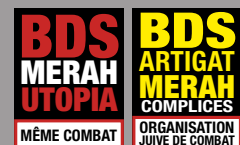
Affiches collées sur les locaux d'EELV et du cinéma Utopia, Toulouse 2016