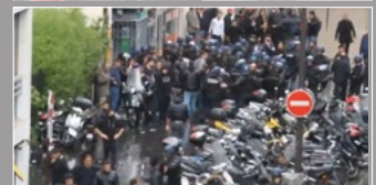
Agression d'un manifestant par la LDJ, rue de la Roquette et au même moment, protection de la LDJ par la police, Paris, 2014