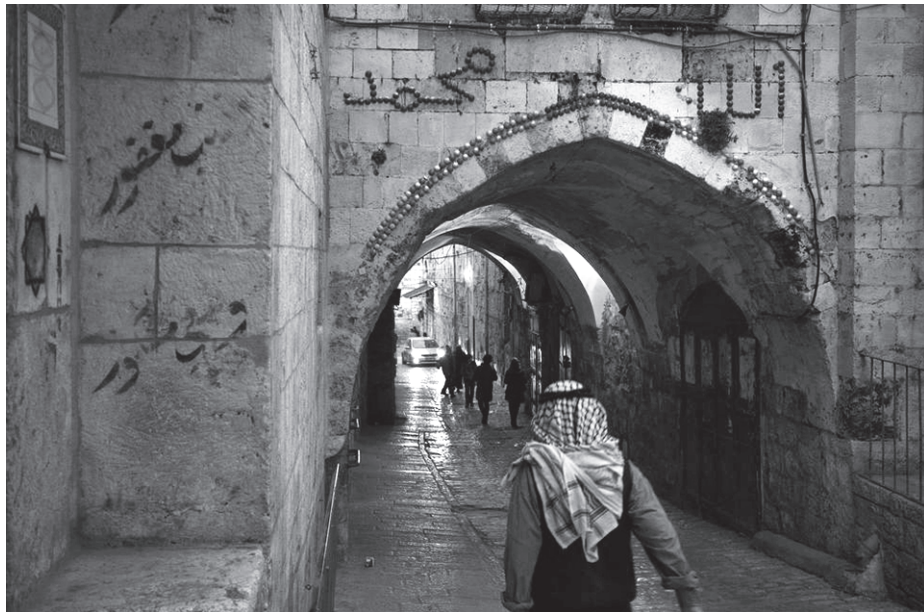
Dans la vieille ville de Jérusalem, 2017.

Ce bulletin se fait et se fera l'écho des activités développées par les groupes locaux de l'AFPS engagés dans la solidarité directe avec des réfugiés palestiniens, en Palestine ou dans les pays voisins, les expériences des uns pouvant servir à tous. Le GT-Réfugiés.