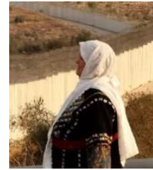
Femme palestinienne inconnue, manifestant contre l'armée d'occupation près du mur illégal

qui empêchera-t-on de penser qu'il y a de par le monde deux poids et deux mesures ?... Le règlement de la crise du Golfe doit permettre de créer un précédent opposable à toutes les atteintes portées aux libertés des peuples et des hommes, et c'est là la justification essentielle et primordiale de notre intervention dans cette région. Jacques Chirac à l'Assemblée le 16/01/1991