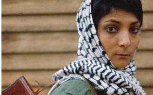
Leïla Khaled, née à Haïfa en Palestine mandataire, exilée au Liban en 1948, militante dès 15 ans