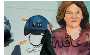
Shirin Abu Akleh, née à Jérusalem Est occupée, journaliste palestinienne, chrétienne, tuée par un soldat en 2022 à Jénine, Cisjordanie occupée