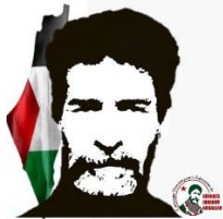
George Ibrahim Abdallah, libanais communiste, plus ancien prisonnier politique en France