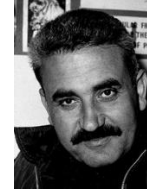
Dr Georges Habash, né à Lydda en Palestine mandataire, résistant, expulsé de Paris en 1992 par F. Mitterrand