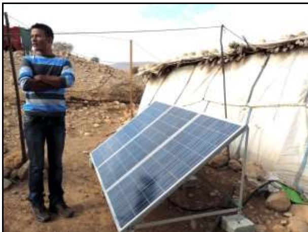
MA'AN équipe les Bédouins en panneaux solaires.

En outre les bénéficiaires participeront aux travaux de rénovation.