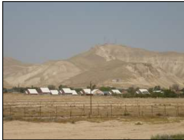
Une colonie israélienne de la Vallée du Jourdain

Association France Palestine Solidarité Maison de Quartier - 97, Galerie Arlequin 38100 Grenoble Courriel : afps38@yahoo.fr Site : www.afps-isere-grenoble.org