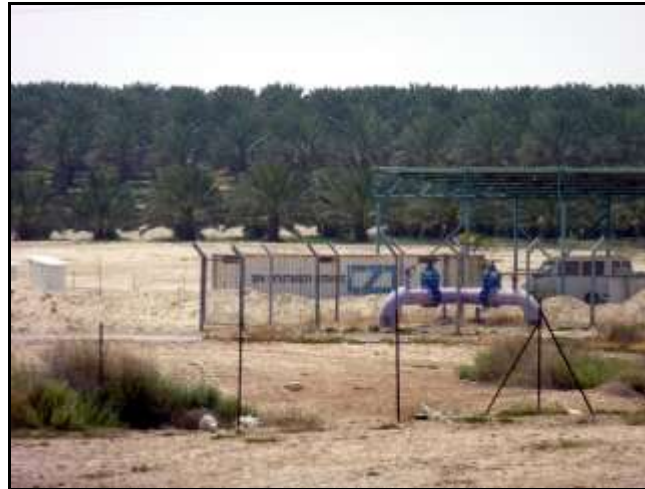
Culture intensive de palmiers dattiers dans une colonie agricole