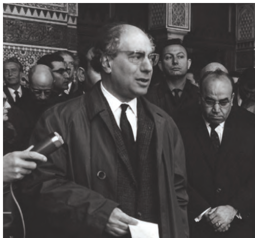
Maxime Rodinson.