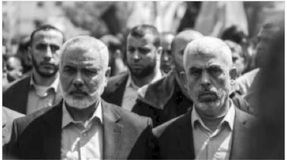
Le tandem dirigeant du Hamas Ismail Hanyeh (à gauche) et Yahya Sinouar (à droite)

islamique ». Cette charte était imprégnée d'une rhétorique antisémite et conspirationniste, dont il n'était que temps pour le Hamas de se distancier enfin. C'est désormais acté dans ce « document politique » qui inscrit la lutte du Hamas dans une dynamique politique, et non plus religieuse. (ndlr : souligné par nous). Toute reconnaissance explicite d'Israël reste