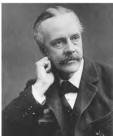
Arthur James Balfour (25 juillet 1848) - 19 mars 1930, Premier ministre du Royaume-Uni et chef du parti conservateur, célèbre pour son action en tant que ministre des Affaires étrangères pendant la Première Guerre mondiale.

(...) C'était certainement la décision de politique étrangère la plus cruelle et la plus stupide prise par un gouvernement britannique. Aujourd'hui de par le monde il y a 6,5 millions de réfugiés palestiniens dépossédés. Plus de 1,5 million vivent une existence misérable dans 58 camps de réfugiés en Jordanie, au Liban, à Gaza et en Cisjordanie incluant Jérusalem Est, attendant en vain de retourner à leurs maisons et fermes familiales. Ceux qui vivent encore dans les restes déchirés de la Palestine ont été sous une occupation militaire israélienne brutale ou un