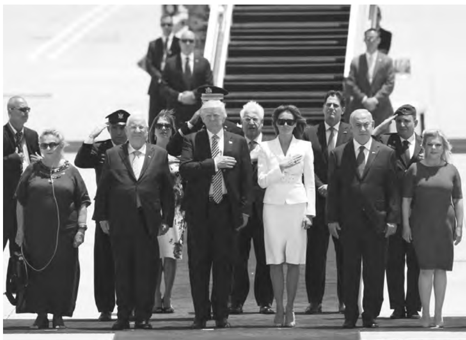
Donald Trump lors de la cérémonie d'accueil par le président israélien Reuven Rivlin et le Premier ministre Benjamin Netanyahu à l'aéroport de Tel Aviv.

Pour toutes ces raisons, l'Arabie saoudite avait besoin de l'appui amé-