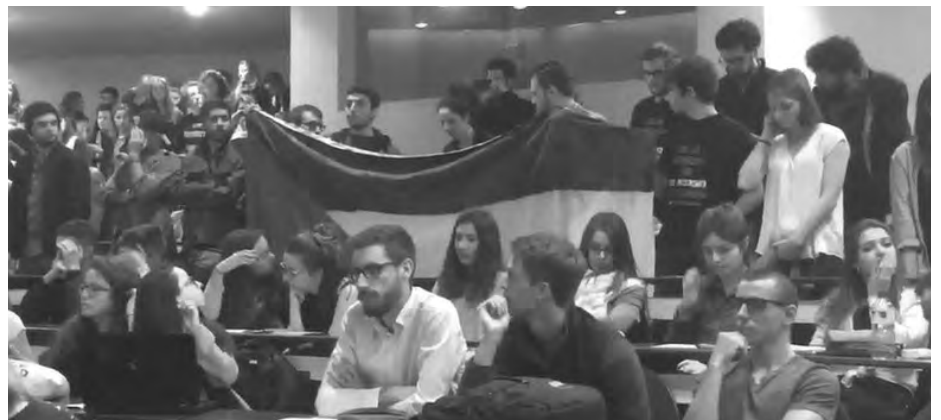
L'ambassadeur d'Israël Aliza Bin-Noun, boycotté par des étudiants pro-palestiniens à Sciences Po Rennes le 30 mars 2017. Il s'est exprimée dans un amphithéâtre quasiment vide à Science Po Rennes, la plupart des étudiants ayant quitté la salle en signe de protestation, avant de déclencher l'alarme incendie.

L'Association des Universitaires pour le Respect du Droit International en Palestine (AURDIP) a appris que l'Institut d'Études Politiques - Sciences Po Rennes avait conclu en 2017 un accord de coopération avec l'Université de Tel Aviv. L'AURDIP tient à vous informer que l'Université de Tel Aviv est une Université israélienne publique impliquée en tant qu'institution dans les violations du droit international résultant de la politique de l'État